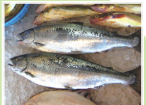
※写真はイメージです。実際の商品とは異なります。