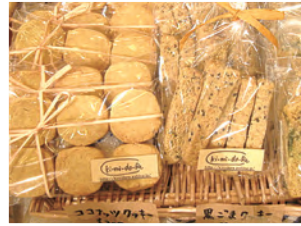
会場写真はすべて過去の「KBS京都マルシェ」より